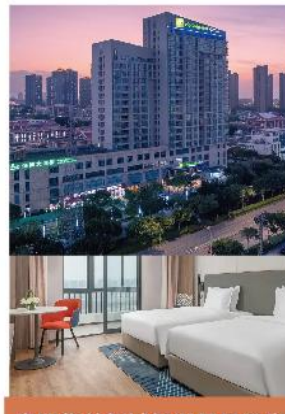
廈門集美新城智選假日酒店