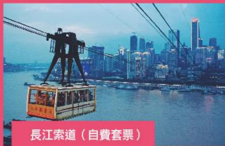
長江索道 (自費套票)