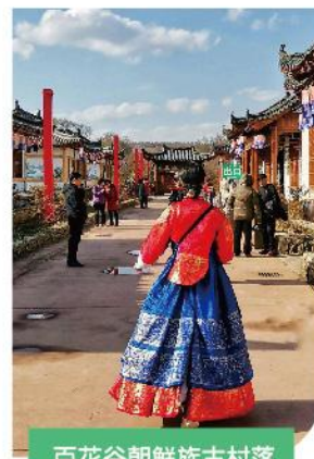
百花谷朝鮮族古村落