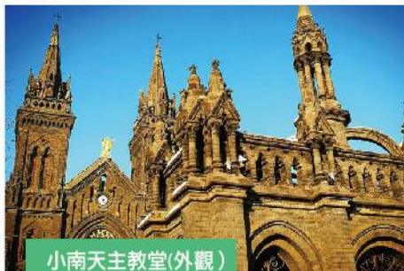
小南天主教堂(外觀)