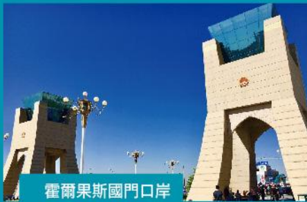
霍爾果斯國門口岸