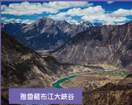
雅魯藏布江大峽谷