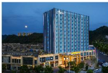
鳳凰凱盛國際酒店