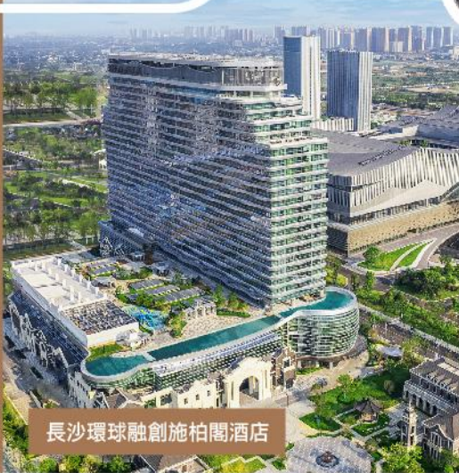
長沙環球融創施柏閣酒店