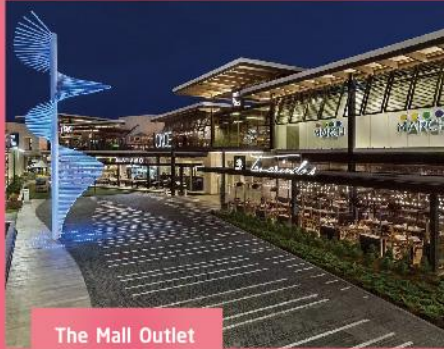
The Mall Outlet