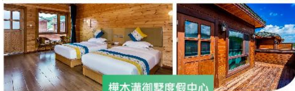
樺木溝御墅度假中心