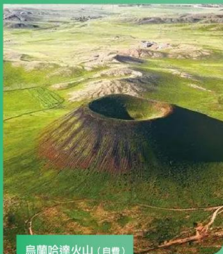
烏蘭哈達火山 (自費)