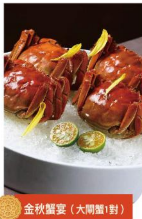
金秋蟹宴 (大閘蟹1對)