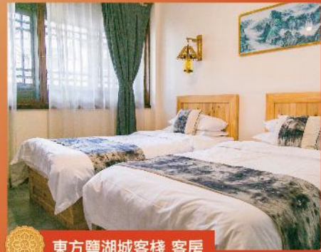
東方鹽湖城客棧 客房