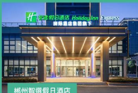
郴州智選假日酒店