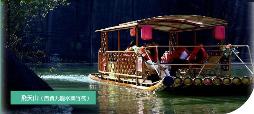
飛天山 (自費九龍水寨竹筏)