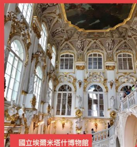
國立埃爾米塔什博物館