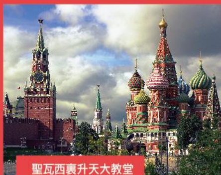
聖瓦西裏升天大教堂