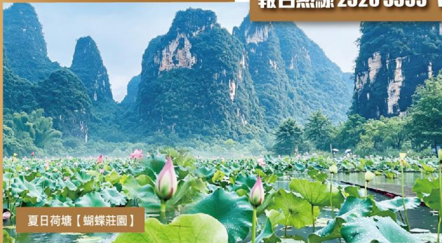
夏日荷塘【蝴蝶莊園】