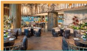
湖州南太湖洲際(帆船)酒店