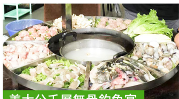
姜太公千層無骨釣魚宴

3 酒店自助早餐 → 酒店自由活動約 11:00 離開 → 午餐【順德黃媽媽私房菜】 → 廣東小周莊“逢簡水鄉” → 乘坐國內旅遊巴士 深圳 → 送返指定關口解散口解散