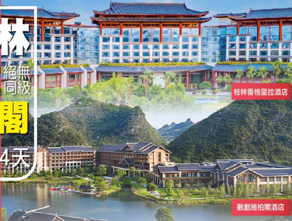
桂林香格里拉酒店