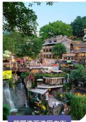
龍門浩下浩里老街