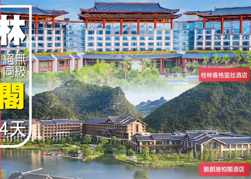
桂林香格里拉酒店