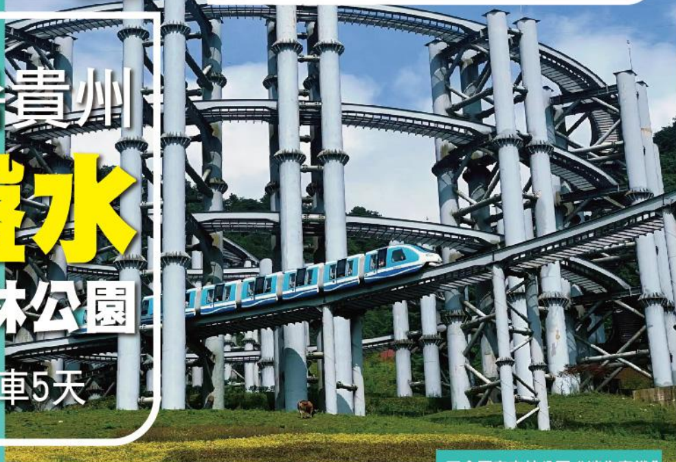
玉舍國家森林公園“迷你高鐵”