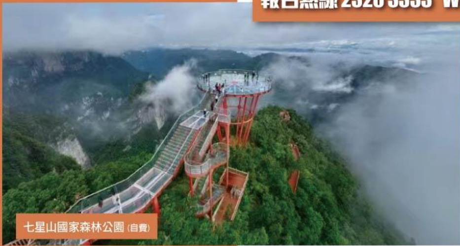
七星山國家森林公園 (自費)