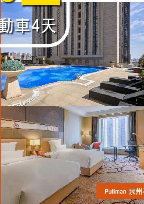
Pullman 泉州石獅明昇鉑爾曼酒店