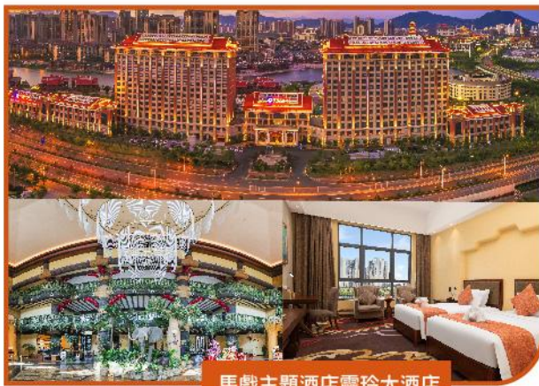
馬戲主題酒店靈玲大酒店