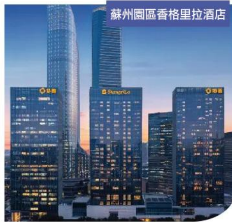
蘇州園區香格里拉酒店