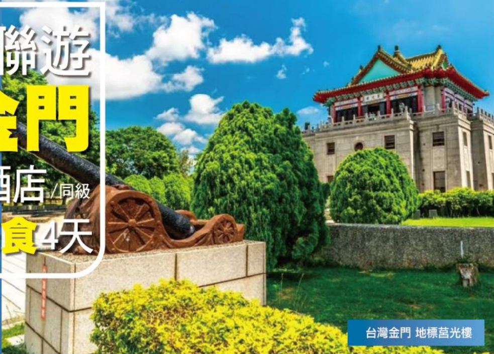
台灣金門 地標莒光樓