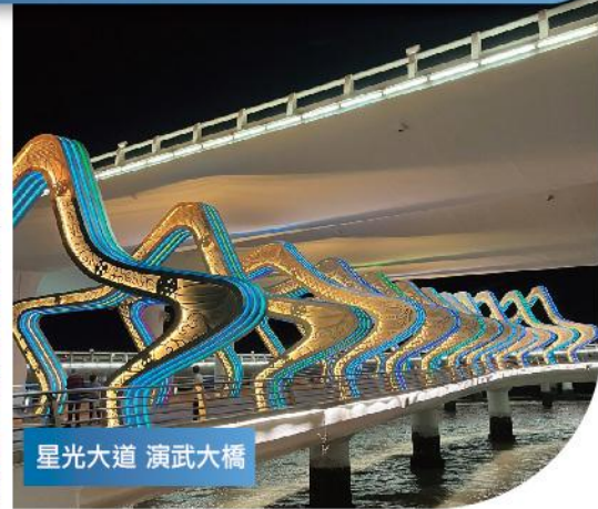
星光大道 演武大橋