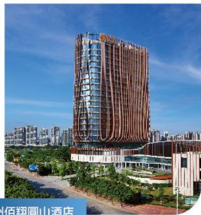
漳州佰翔圓山酒店