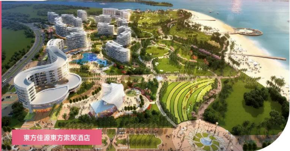
東方佳源東方索契酒店