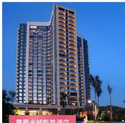
鳳凰水城凱萊酒店