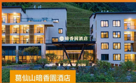
葛仙山暗香園酒店