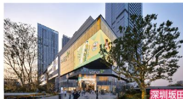
深圳坂田萬科廣場