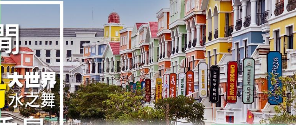
富國大世界不夜城