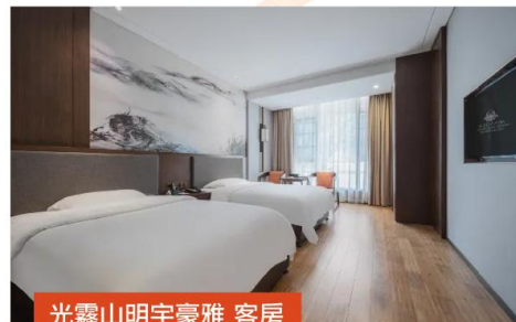
光霧山明宇豪雅 客房