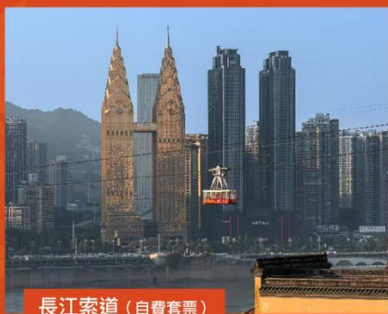
長江索道 (自費套票)