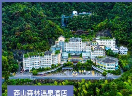
莽山森林溫泉酒店