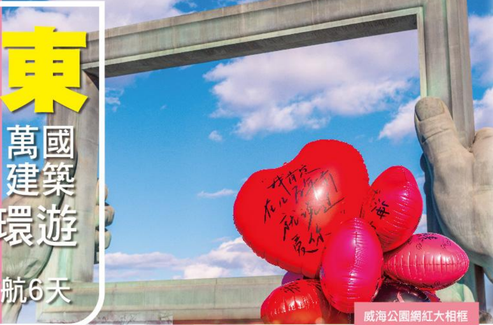
威海公園網紅大相框