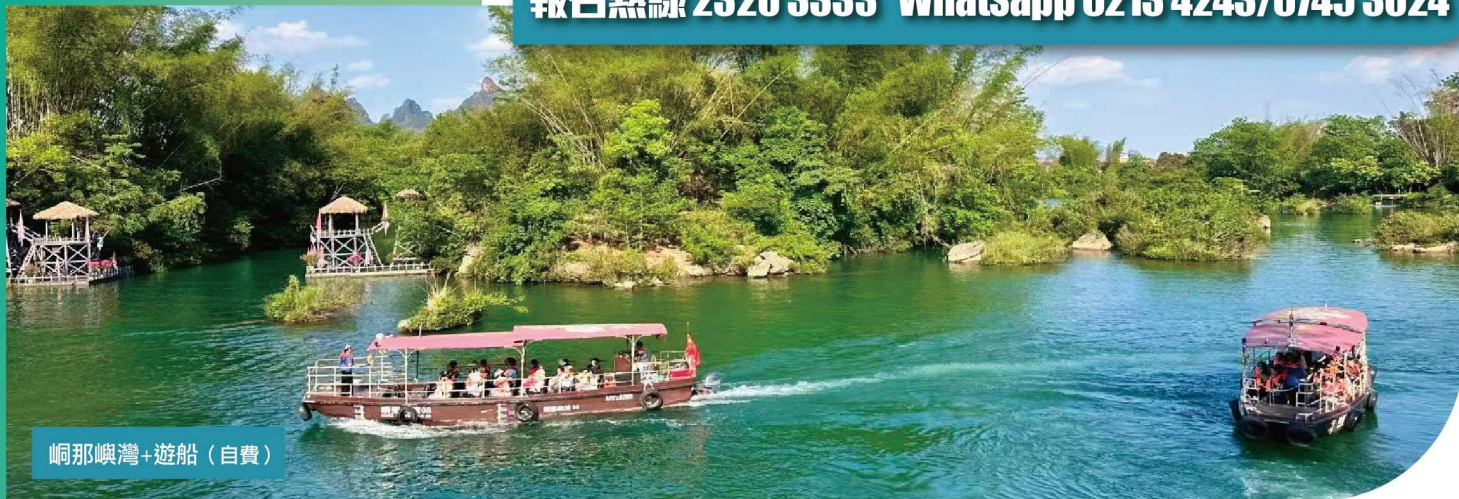
峒那嶼灣+遊船 (自費)