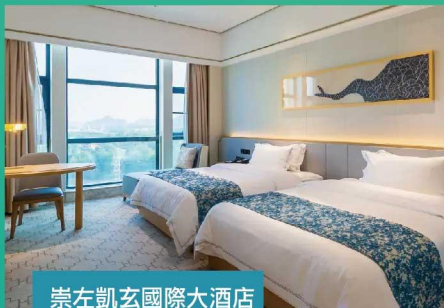
崇左凱玄國際大酒店