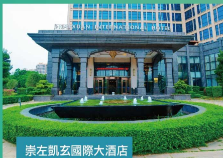
崇左凱玄國際大酒店