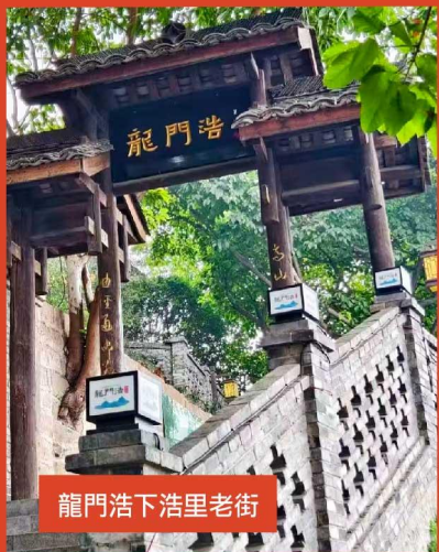
龍門浩下浩里老街