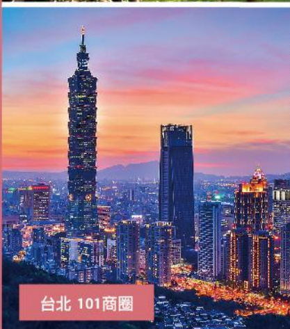
台北 101 商圈