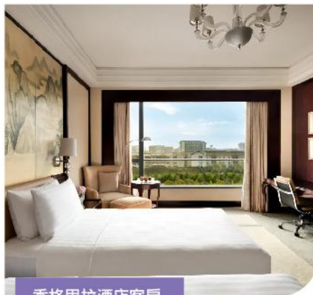
香格里拉酒店客房