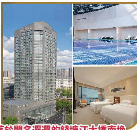
坐落於聞名遐邇的錢塘江大橋南塊 杭州龍塘福朋喜來登酒店