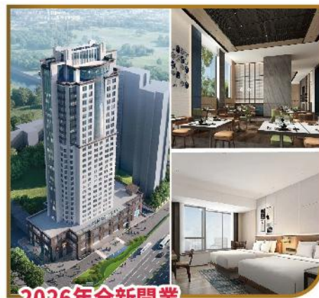
2026年全新開業 無錫福朋喜來登酒店