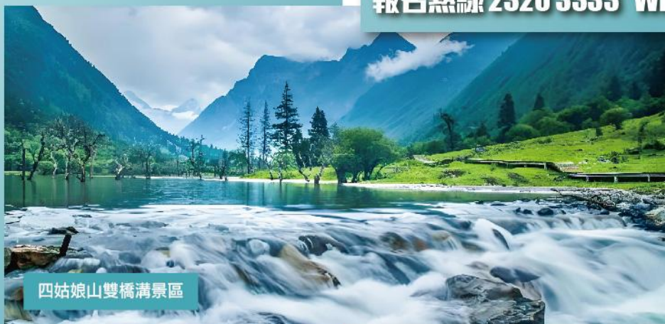
四姑娘山雙橋溝景區