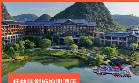
桂林融創施柏閣酒店