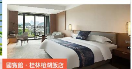
國賓館·桂林榕湖飯店