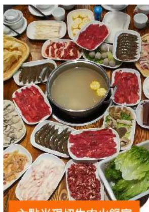
六點半現切牛肉火鍋宴