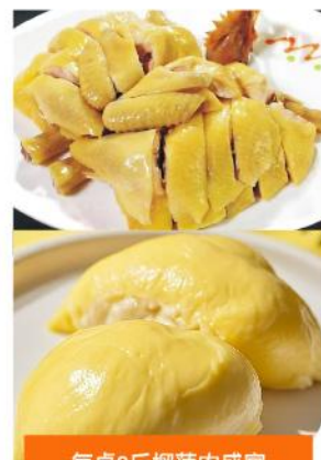
每桌8斤榴蓮肉盛宴