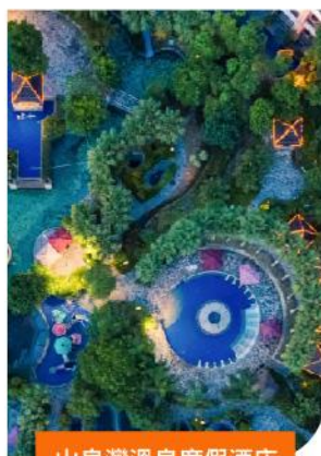
山泉灣溫泉度假酒店

酒店 升級1晚溫泉之鄉 恩平準5星 山泉灣溫泉酒店 無限次浸泡溫泉 親子水上樂園