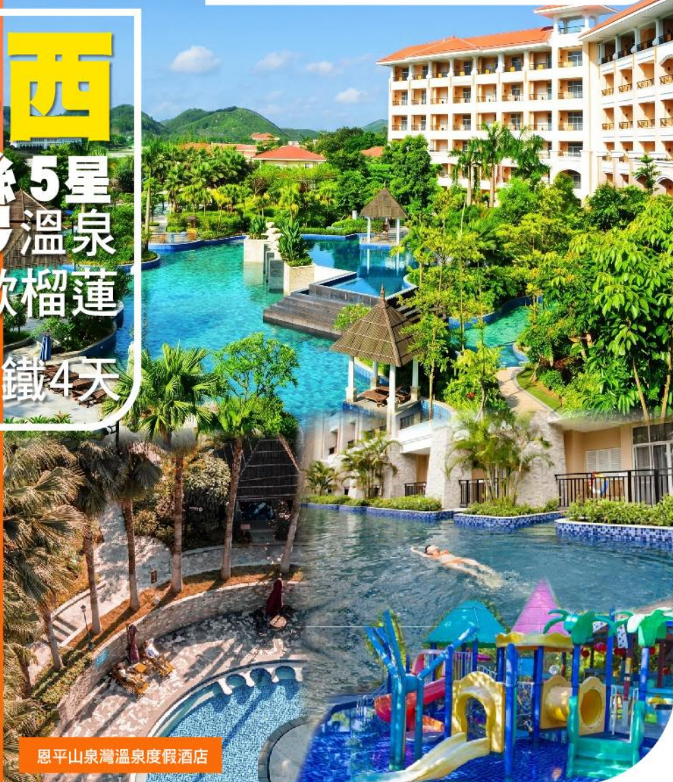
恩平山泉灣溫泉度假酒店