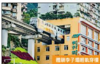
體驗李子壩輕軌穿樓

*如特殊情況往返高鐵/動車未能安排深圳北站直達則需要在廣州南/長沙南中轉。如未能於福田/羅湖送團, 將改為皇崗口岸解散, 敬請留意! *行程中所安排之購物商店, 如遇不可抗力因素停閉或者關閉, 本公司有權調整安排其他購物店, 但購物商店數量不變, 客人不得追究, 敬請留意! *有關高鐵團隊, 如負責於12306系統內自行退票, 責任自負, 謝謝配合!