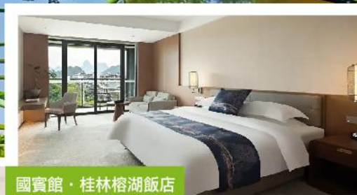
國賓館·桂林榕湖飯店