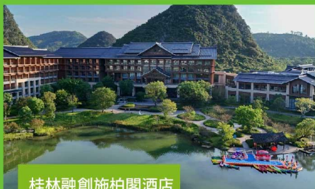
桂林融創施柏閣酒店