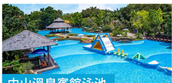
中山溫泉賓館泳池