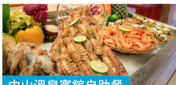
中山溫泉賓館自助餐