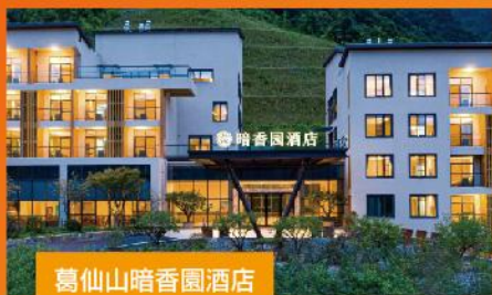
葛仙山暗香園酒店