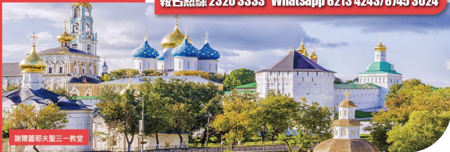
謝爾蓋耶夫聖三一教堂