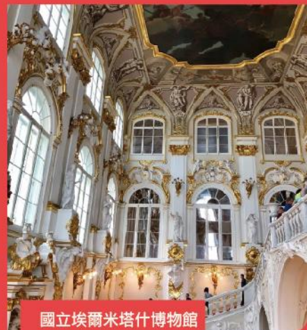
國立埃爾米塔什博物館