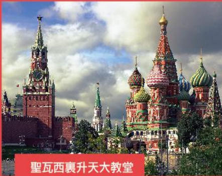
聖瓦西裏升天大教堂