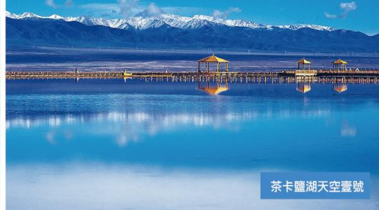
茶卡鹽湖天空壹號