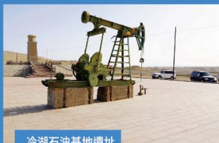
冷湖石油基地遺址