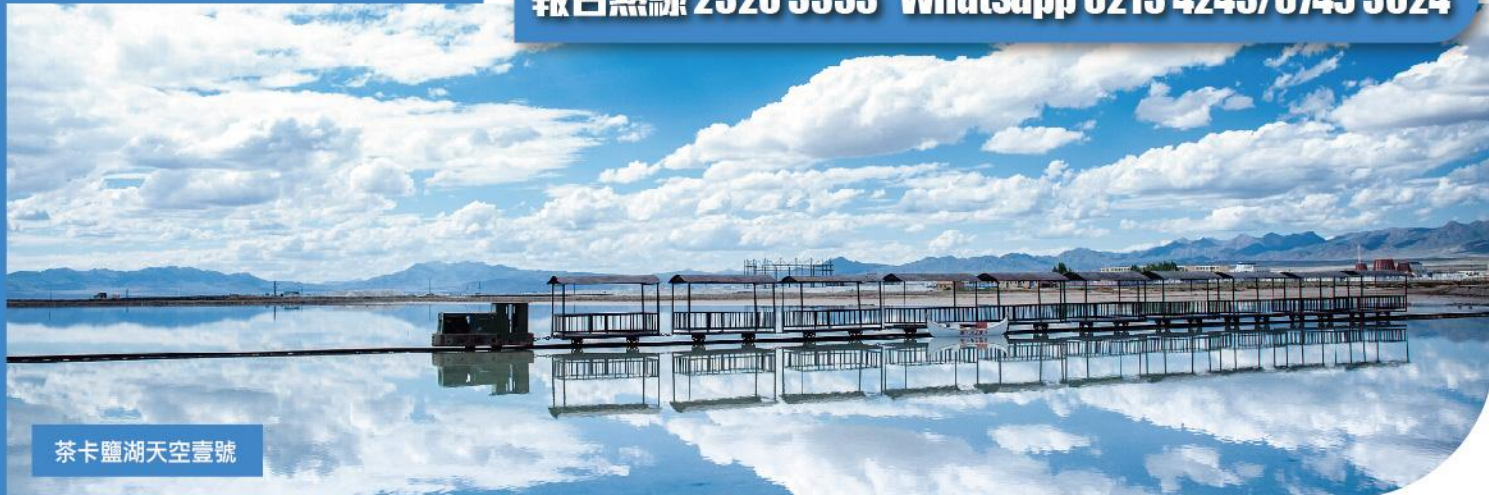
茶卡鹽湖天空壹號