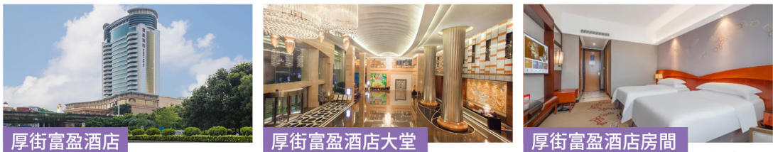
厚街富盈酒店 厚街富盈酒店大堂 厚街富盈酒店房間

$90 旅行團服務費 每人每天計 (大小同價) 日期時間 出發日期: (大假期除外) 5月20日-7月20日 集合時間: (逾時不候) 08:30 羅湖口岸 / 09:30 深圳灣口岸