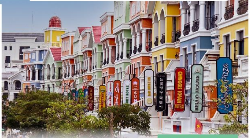
富國大世界不夜城