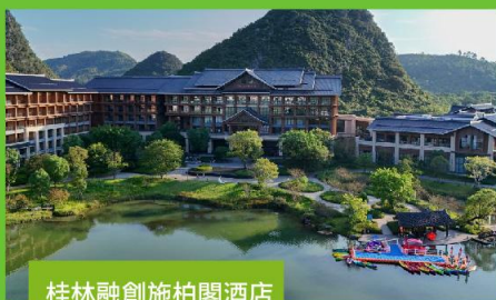
桂林融創施柏閣酒店