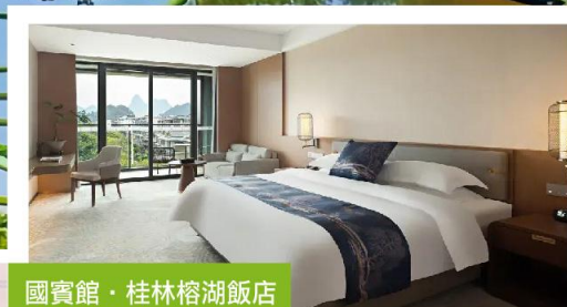
國賓館·桂林榕湖飯店