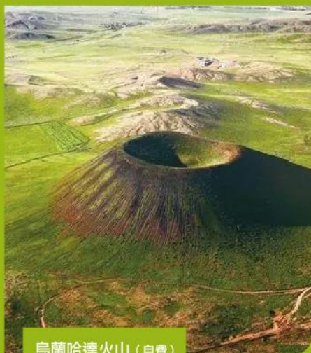
烏蘭哈達火山 (自費)