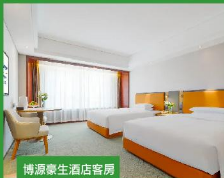
博源豪生酒店客房