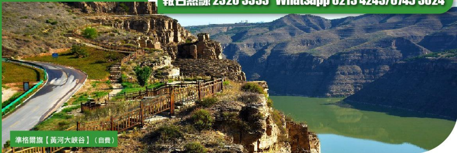
準格爾旗【黃河大峽谷】(自費)