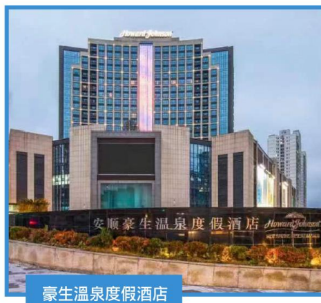
豪生溫泉度假酒店