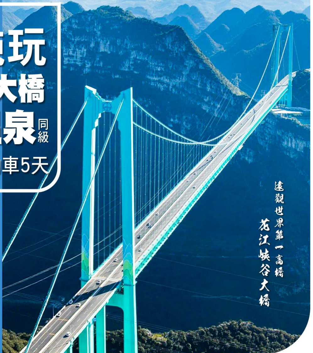
遠觀世界第一高橋 花江峽谷大橋