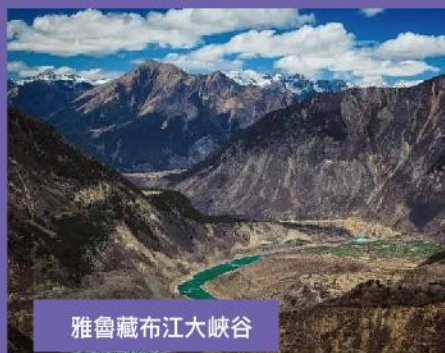
雅魯藏布江大峽谷